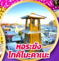
หอรบั้ง โทคิโนะคานะ