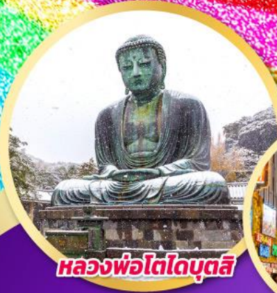
หลวงพ่อโตโดบุตสึ