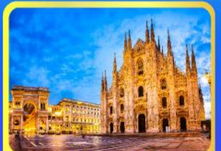
มหาวิหารมิลาน