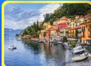
หมู่บ้านเบลลาจีโอ