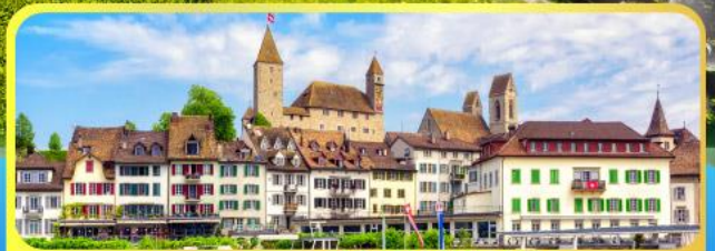
แรมพอร์สวิสใจนำ