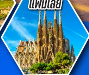
โบสถ์ซากราดา แฟมิเลีย