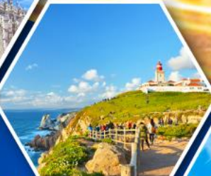
แหลมโรคา