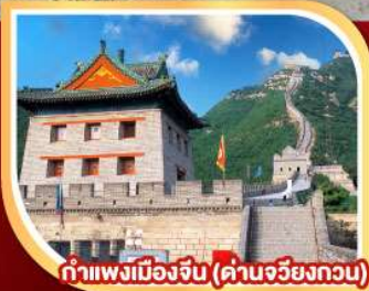
กำแพงเมืองจีน (ด่านจวิรงกวน)