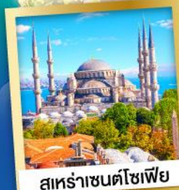
สุหระ่าเซนตโซเฟีย