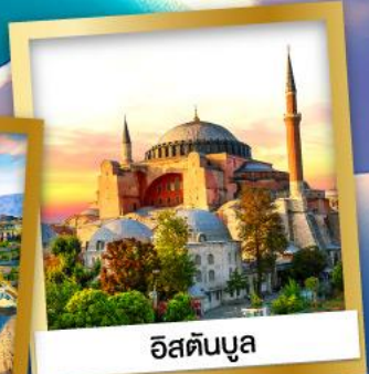
อิสตันบูล