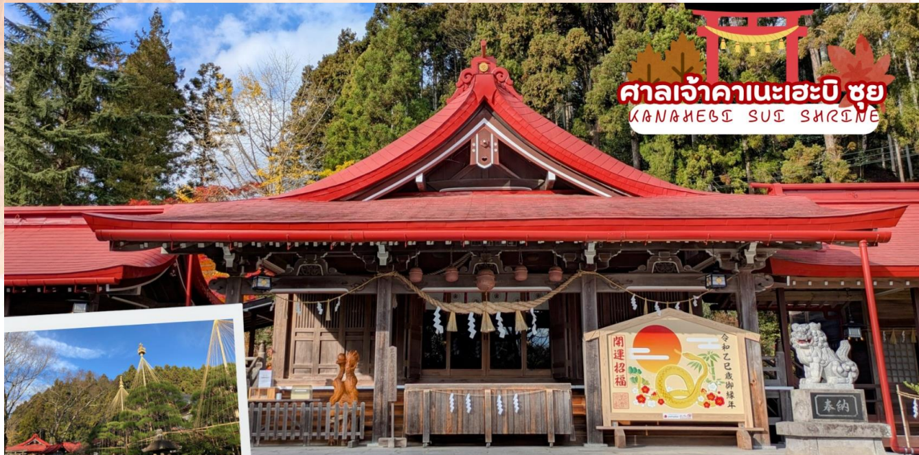
ศาลเจ้าคานะเฮะบิ ซุย KANAHÉBI SUI SHRINE