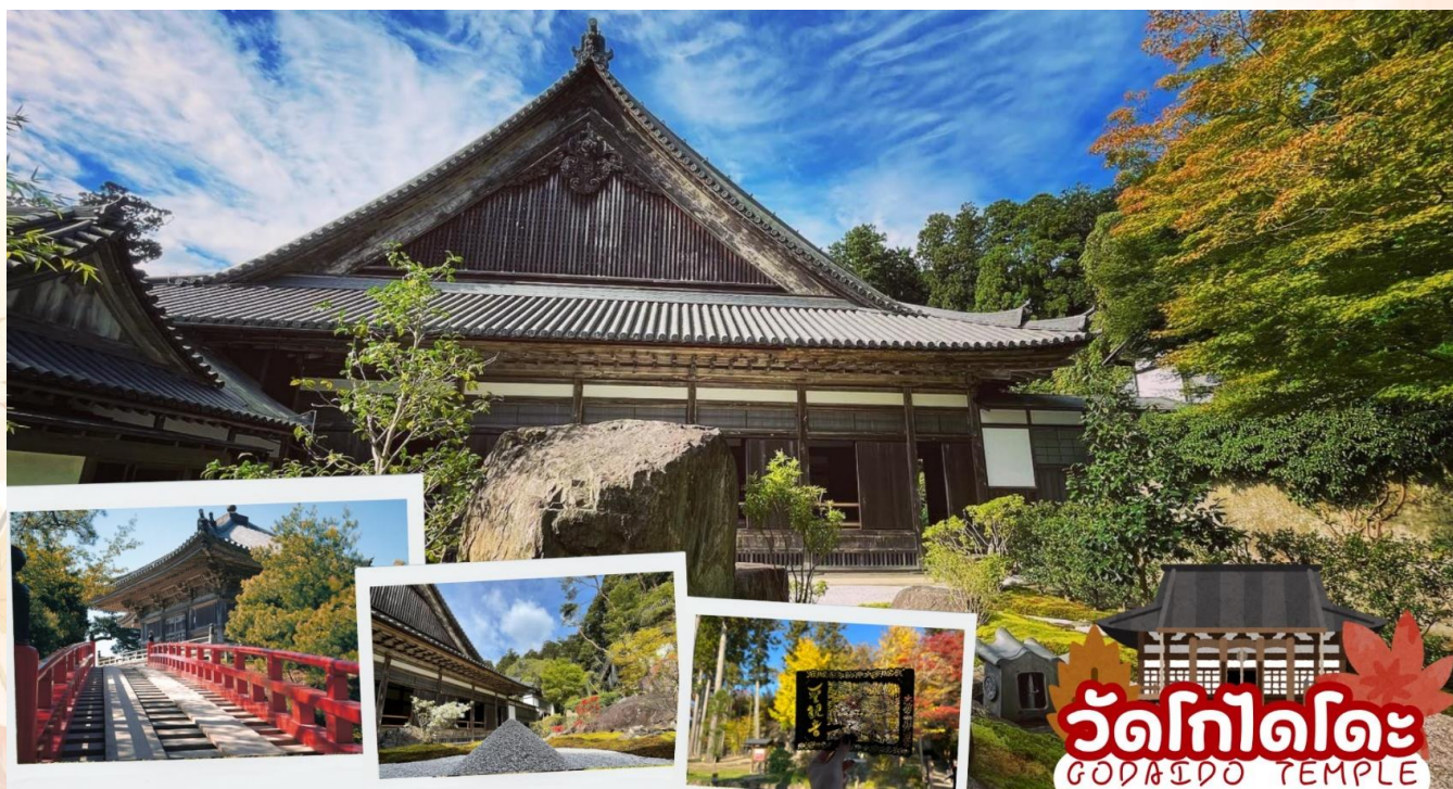
วัดโกไดโตะ GODAENDO TEMPLE

กลางวัน รับประทานอาหารกลางวัน ณ ร้านอาหาร (มื้อที่ 6)