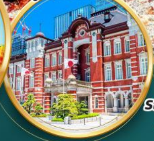
ถ่ายรูปหน้าสถานีโตเกียว