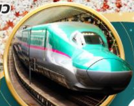
รถไฟ JR TOHOKU SHINKANSEN