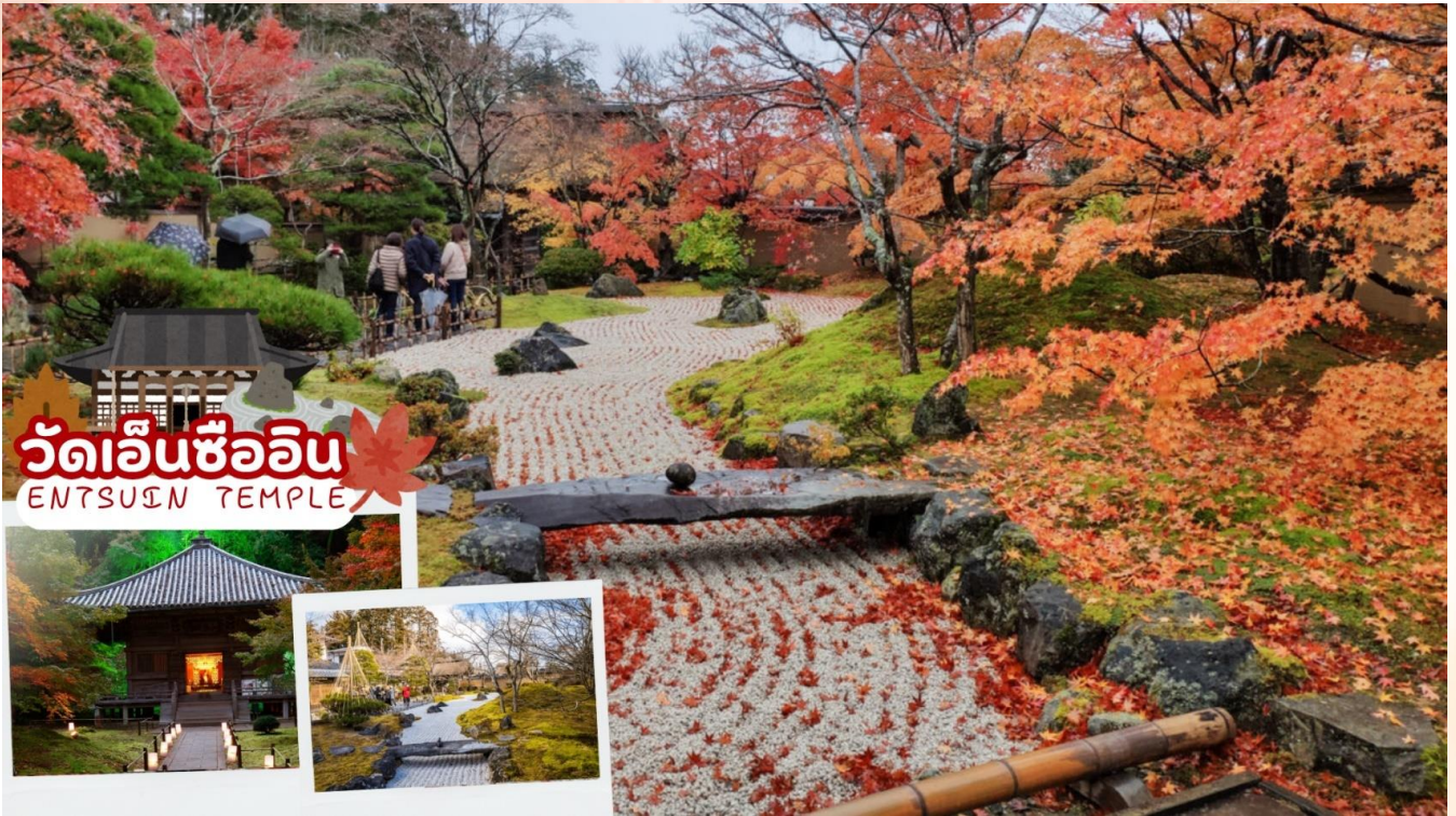
วัดเอ็นซึอิน ENTSUIN TEMPLE

วัดโกไดโดะ (Godaido Temple) เป็นวัดขนาดเล็ก ติดกับท่าเรือมัตสึชิมะ ตั้งอยู่ในตำแหน่งที่โดดเด่น ทำให้วัดแห่งนี้กลายเป็นสัญลักษณ์ของเมืองมัตสึชิมะ สร้างขึ้นในปี 807 เป็นที่ประดิษฐานของพระพุทธรูป 5 องค์ ซึ่งก่อตั้งโดยพระสงฆ์ที่ก่อตั้งวัดซุอิกันจิ (Zuiganji Temple) โดยรูปปั้นจะถูกนำมาให้ประชาชนได้ชมกันทุกๆ 33 ปี (ครั้งสุดท้ายที่นำออกมาจัดแสดงคือปี 2006)