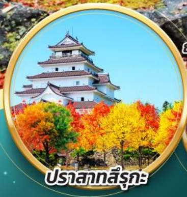
ปราสาทสึรุกะ