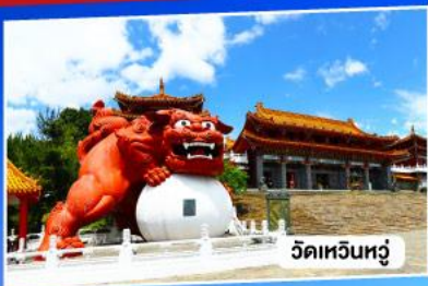
วัดเหวินหลู่

อาลีซาน ทะเลสาบสุริยันจันทรา จั๋วเฟิ่น 5วัน 3คืน