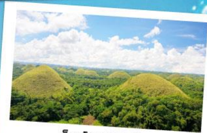
ช็อคโกแลตฮิลล์