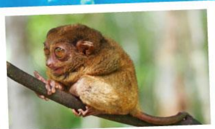
ลิงคาร์เธียร์