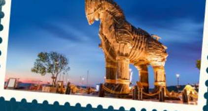
ถ่ายรูปม้าไม้แห่งทรอย

ขึ้นกระเช้าชมวิวสุเหร่าอายุบลุด้าน และกระเช้ายอดเขาเออร์ซีเยส