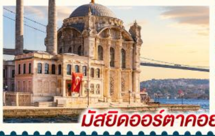
มิสยิดออร์ตาคอย