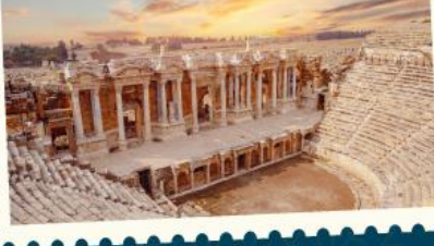
เมืองโบราณเฮียราโพลิส