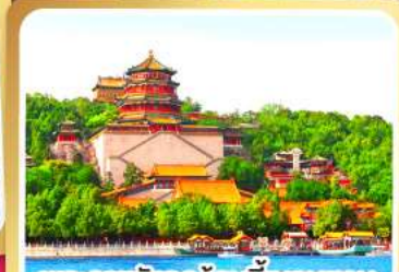
พระราชวังฤดูร้อนอ้อเหอหยวน