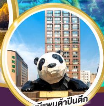
หมี่แพนด้าปิ่นตึก