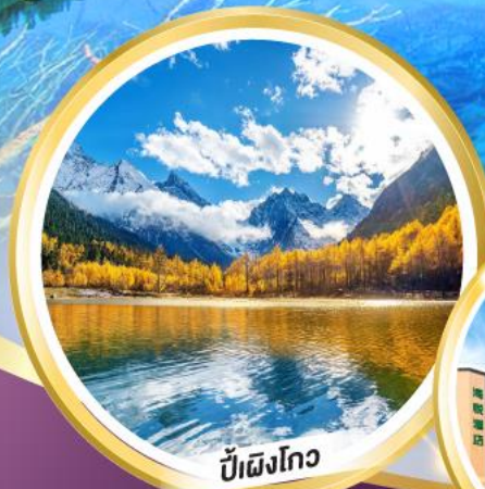
ปีเฝงโกว