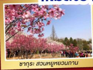
ซากุระ สวนหยูหยวนถาน

จ่ายราคาเดียว..เที่ยวเต็มอิ่ม ..ไม่ลงร้านช้อปปิ้ง