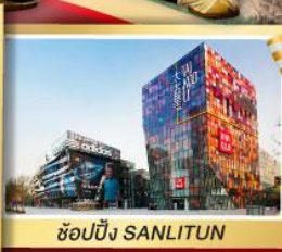
ช้อปปิ้ง SANLITUN