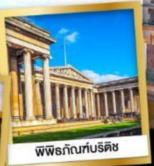
พิพิธภัณฑ์บริติช