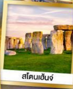
สโตนเฮนจ์