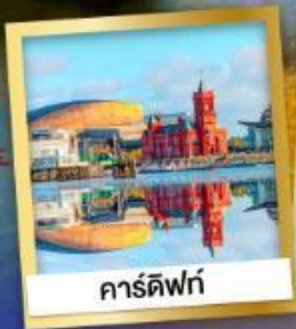
คาร์ดิฟฟ์