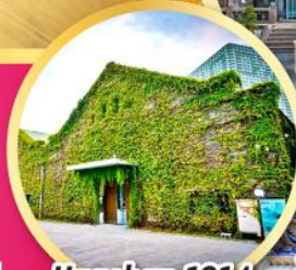
Huashan 1914 Creative Park