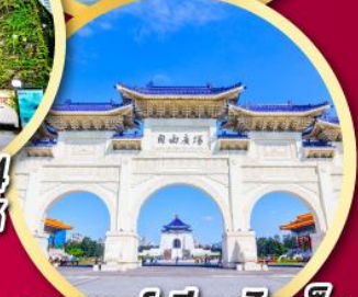
อนุสรณ์เจียงไคเช็ค