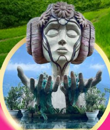
โมนาซ่า ซาปา คาเฟ่