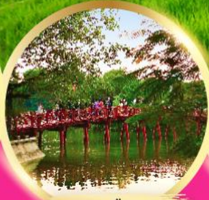
ทะเลสาบคินคาบ