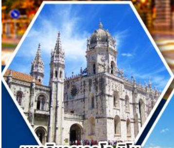
มหาวิหารเจอรูนิโม