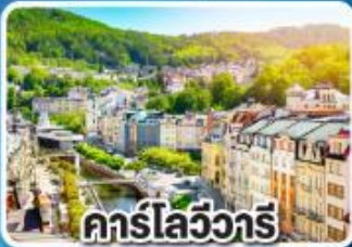
คาร์ลสไบร์