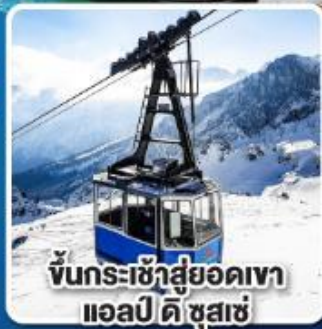
ขึ้นกระเช้าสู่ยอดเขา แอลป์ ดิ ซูสเซ

เที่ยวเมืองอินส์บรุค เพชรเม็ดงามสุดโรแมนติก แห่งแคว้นทิโรล