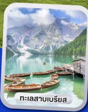
ทะเลสาบเบรียส