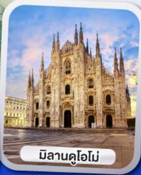
มิลานคูโอโม