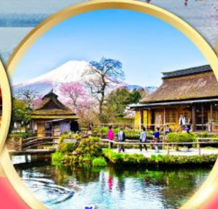
หมู่บ้านน้ำใสโอชิโนะฮักโก