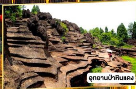
อุทยานป่าหินแดง