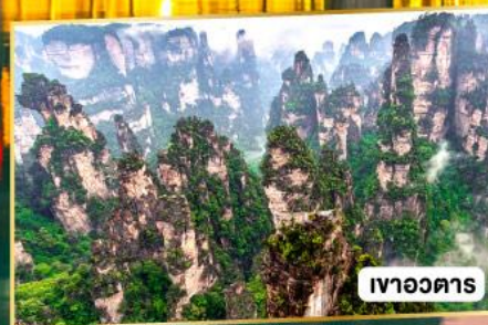
เวาอวดาร