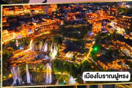
เมืองโบราณฝูหลง