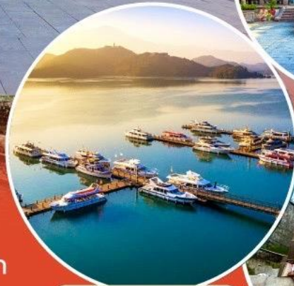
ทะเลสาบสุริยอันจินตรา