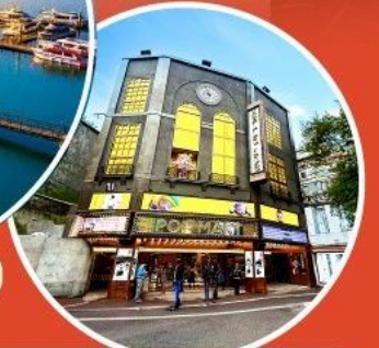
ร้าน POP MART ใหญ่ที่สุดในไต้หวัน