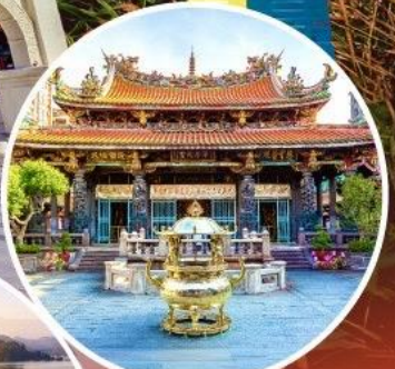
วัดหลงซาน