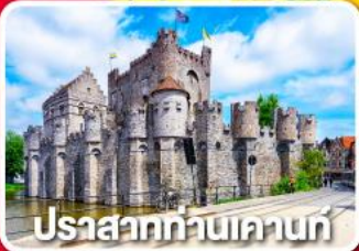
ปราสาทท่านเคานท์