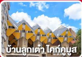
บ้านลูกเต่า โคกคูนูส