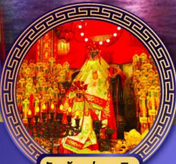
วัดเจ้าแม่กวนอิม ฮ่องกง