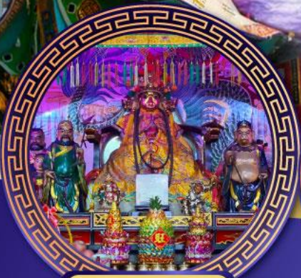
ศาลเจ้าหังเจีย