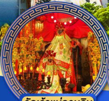
วัดเจ้าแม่กวนอิม ฮ่องกง