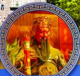
วัดกวนโถ