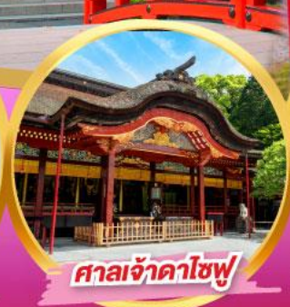
ศาลเจ้าคาโซฟุ