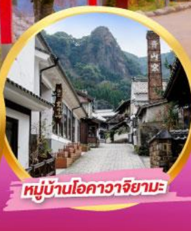
หมู่บ้านโอคาวาจิยามะ