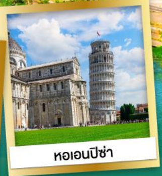
หอเอนปิซ่า