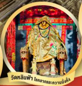
วัดหลินฟ้า ไท่ลางและสวนบึงตั้ง