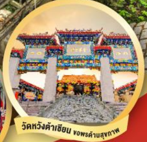
วัดหวังต้าเซียน ฮ่องกง

เมนูพิเศษ.. ห่านย่าง, ต้มช่าฮ่องกง และชาบูสโตร์ฮ่องกง