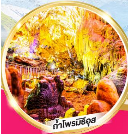
ถ้ำไฟรมิธิอุส