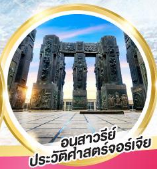
อนสาวรีย์ ประวัติศาสตร์จอร์เจีย