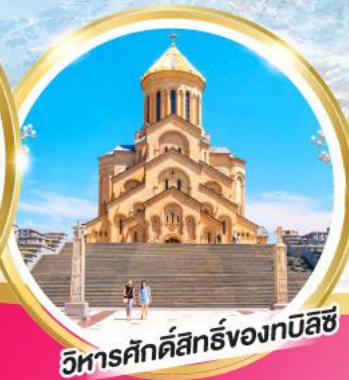
วิหารศักดิ์สิทธิ์ของทบิลีซี