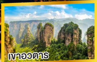
เงาอวตาร