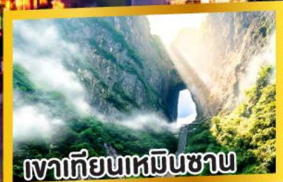
เงาเทียนเหมินซาน