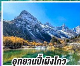
อุทยานปี้ผิงโกว