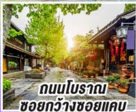
ถนนโบราณ ชอยกวางชอยแคบ