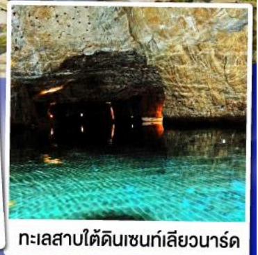
ทะเลสาบใต้ดินเซนต์เลียวนาร์ด

ล่องเรือชมทะเลสาบใต้ดินเซนต์เลียวนาร์ด ทะเลสาบใต้ดินลึกลับ สุด Unseen แห่งสวิตเซอร์แลนด์