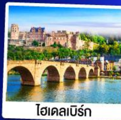
ไฮเดลเบิร์ก