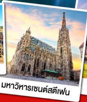
มหาวิหารเซนต์สตีเฟน