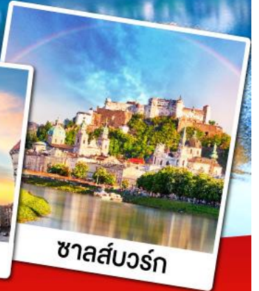
ซาลส์บวร์ก