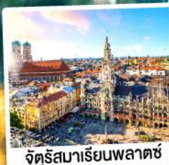
จตุรัสบาเรียนพลาตซ์