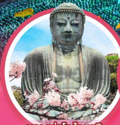
หลวงพ่อดโตโดบุตสึ