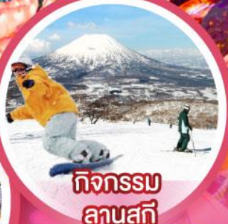
กิจกรรม ลานสกี