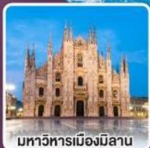
มหาวิหารเมืองมิลาน