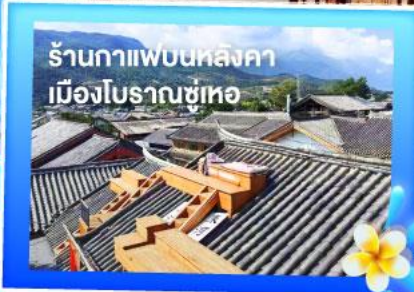
ร้านอาหารหลังคา เมืองโบราณซูทอ