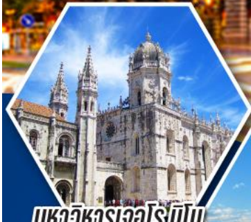
มหาวิหารเจโรนิโม