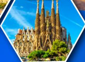
โบสถ์ซากราดา แฟมิเลีย