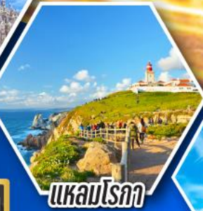
แหลมโรกา