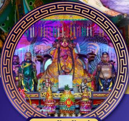
ศาลเจ้าหังเจีย