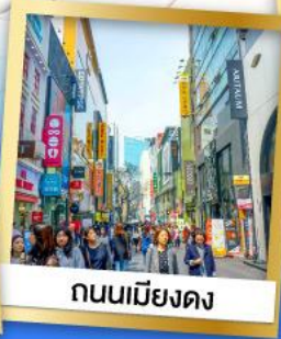
ถนนเมียงดง