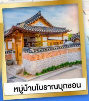
หมู่บ้านโบราณบุกซอน

24-29 ม.ค.68 30 ม.ค.-04 ก.พ.68 07-12, 13-18, 21-26 ก.พ. 68 06-11, 14-19, 21-27 มี.ค. 68