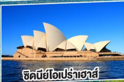
ชิดนีย์โอปราเฮาส์