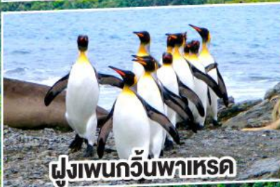
ฝูงเพนกวันพาเหรด