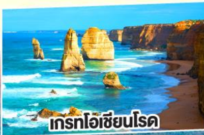
เกรทโอเซียนโรด