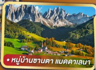
• หมู่บ้านชานตา แมคคาเลนา