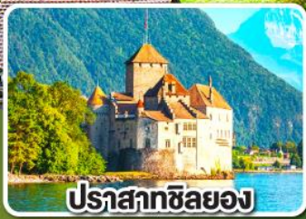
ปราสาทซิลยอง

ประกันสุขภาพและอุบัติเหตุ คุ้มครองสูงสุด 3,000,000