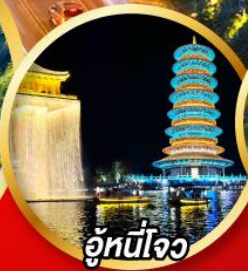
อู่หนี่โจว