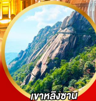
เวาหลิงซาน