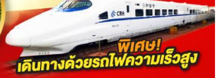
พิเศษ! เดินทางด้วยรถไฟความเร็วสูง