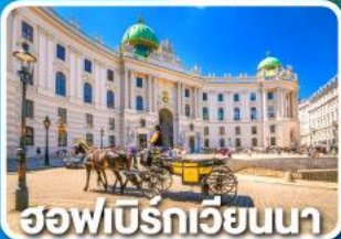
ฮอฟเบิร์กเวียนนา