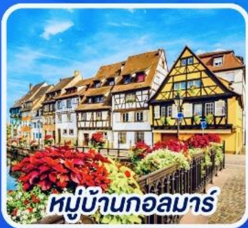
หมู่บ้านกอลมาร์