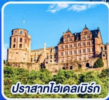
ปราสาทไฮเดลเบิร์ก