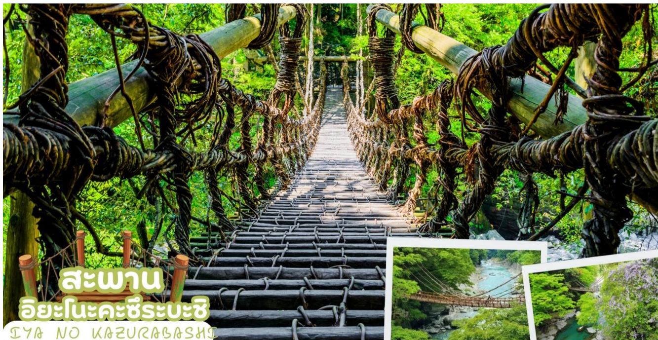
สะพาน อียะโนะคะชิระบะชิ IYA NO KAZURABASHI

นำท่านขอพร ศาลเจ้าโคโตอิระกุ (Kotohira-gu Shrine) หรืออีกชื่อหนึ่งว่า คัมปิระซัง (Konpira san) ตั้งอยู่บนภูเขาโซซุ จังหวัดคางาวะ (Kagawa) ในเมืองโคโตอิระที่สถิตของเทพเจ้าแห่งทะเลจึงเป็นที่เคารพบูชาของชาวเรือ และเป็น 1 ใน 88 ศาลเจ้าและวัดแห่งการแสวงบุญบนเกาะชิโกะคุ ที่ศาลเจ้าแห่งนี้ยังสามารถสักการะ Juichimen-Kannon หรือเจ้าแม่กวนอิม 11 พักตร์ได้ด้วย การเดินขึ้นไปศาลเจ้าจะต้องขึ้นบันไดกว่า 800 ขั้น และหากต้องการเดินขึ้นไปยังศาลเจ้าชั้นในสุด จะต้องเดินต่ออีก 1,368 ขั้น นอกจากนี้ระหว่างทางเดินก่อนมาถึงศาลเจ้าจะผ่านถนนที่มีร้านค้าตั้งอยู่มากมาย