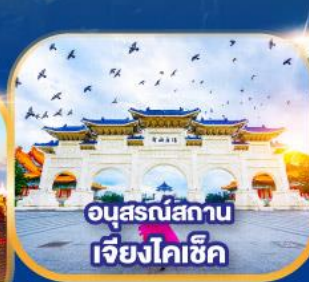
อนุสรณ์สถาน เจียงโคซึก