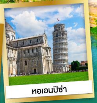
หอเอนปิซ่า