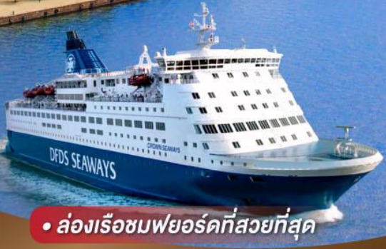
• ล่องเรือชมพยอร์ดที่สวยงามที่สุด