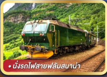
• นั้งรถไฟสายฟลัมสบาน่า