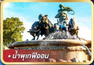
• น้ำพุเทพีออน