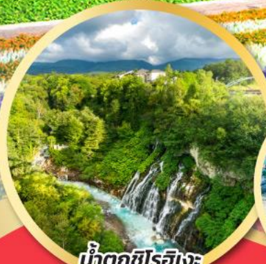
น้ำตกชิโรอิเงะ