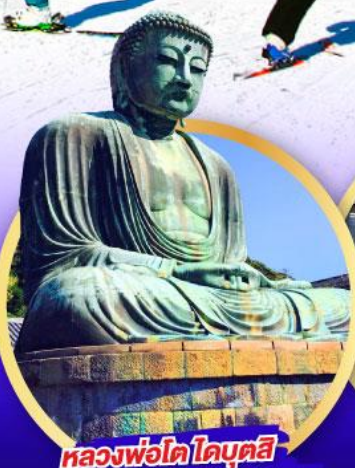
หลวงพ่อโต ไคบุตสึ