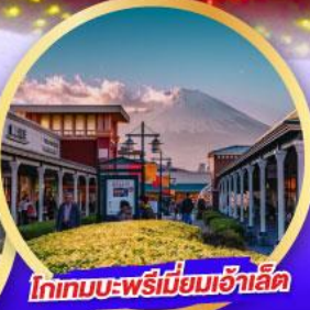
โทเทมบะ-พรีเมียมเอ้าเล็ท

เดินทาง 14-19 ม.ค. 68 21-26 ม.ค. 68 28 ม.ค.-02 ก.พ. 68